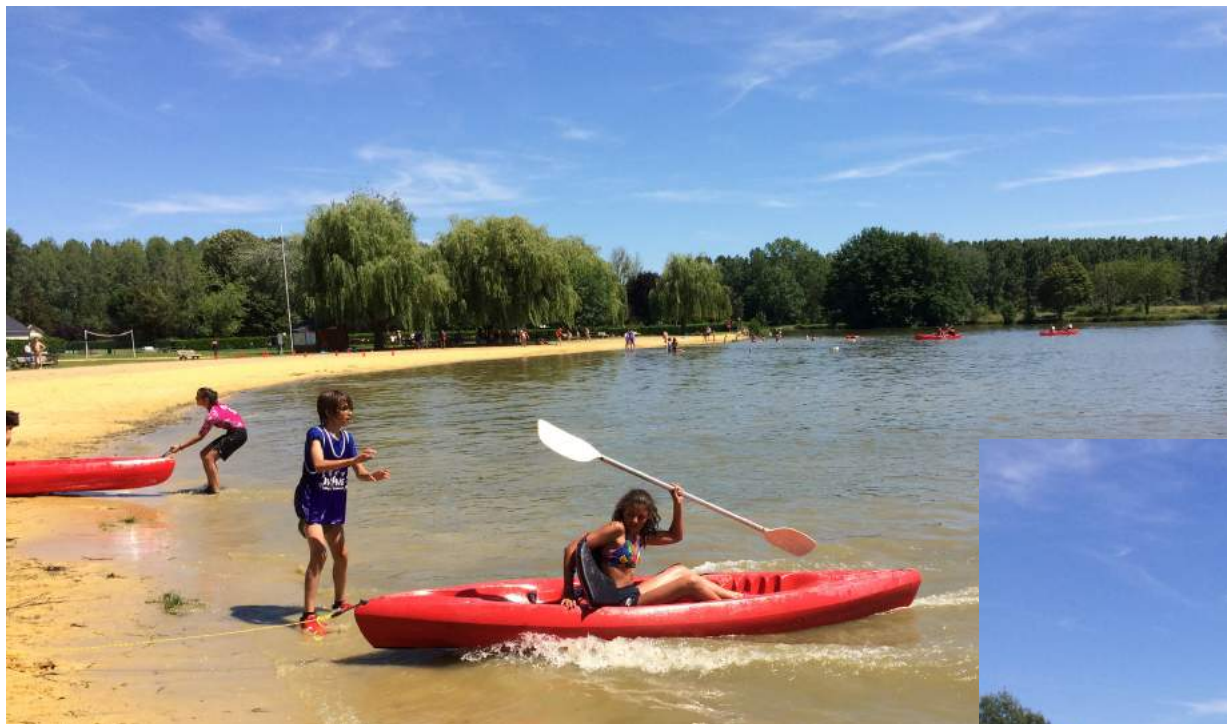
Epreuve originale de kayak corde